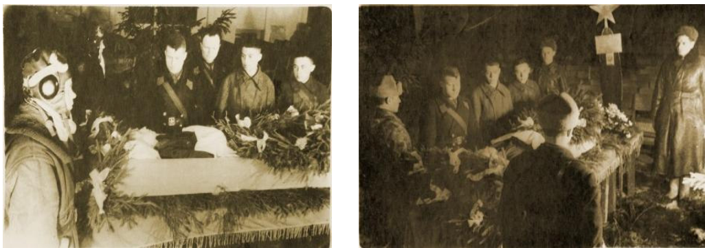
Похороны В.В. Силантьева. г. Кубинка. Февраль 1942 года

После окончания Великой Отечественной войны И.И. Кубарев жил в г. Мытищи Московской области и умер в 1980 году.