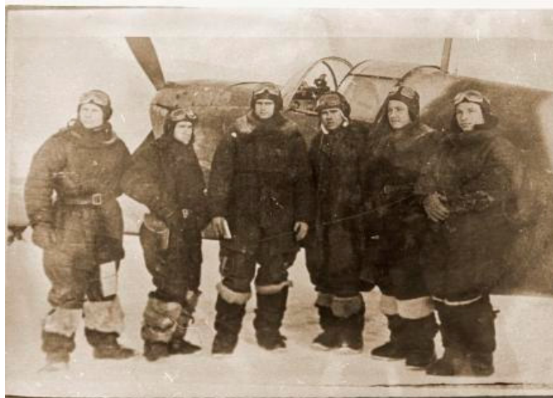
Летчики 172-го ИАП перед боевым вылетом. г. Люберцы, декабрь 1941 – январь 1942 гг.