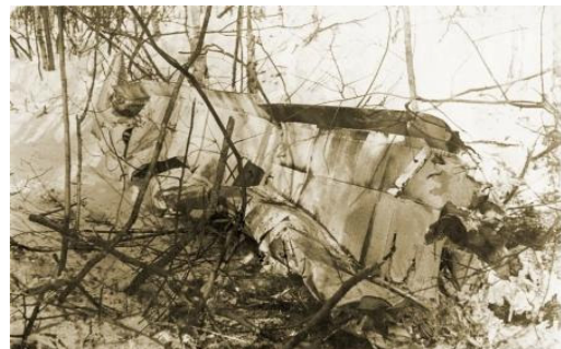
Обломки «Юнкерса». 1942 год