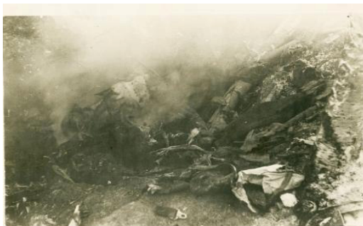
Догорают фашистские стервятники. 1942 год